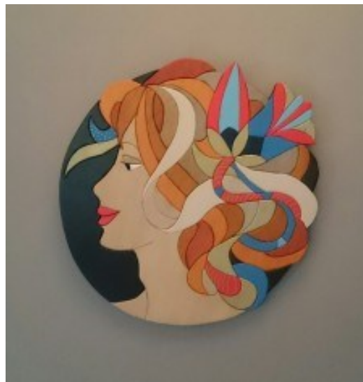
Portret Art Nouveau "Fleuri" hand gezaagd, 82 stukjes

De Stichting Delft-Freiberg is een organisatie die de Stedenband met de Duitse partnerstad Freiberg onderhoudt. Al ruim 33 jaar bestaat deze band die zijn oorsprong vindt in een uitwisseling van scholieren in de jaren 80. Deze uitwisseling viel toen nog onder de gemeente Delft. In 1999 zijn de activiteiten ondergebracht in een zelfstandige stichting en werden de activiteiten uitgebreid naar een breder werkveld. De stichting is er voor alle inwoners van Delft. De Stichting staat als stichting per notariële akte ingeschreven bij de Koninklijke Notariële Broederschap te Delft. Dossiernummer KvK 41146224.