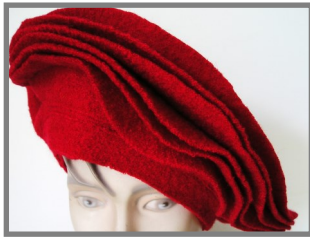
Baret door Wil Kooman